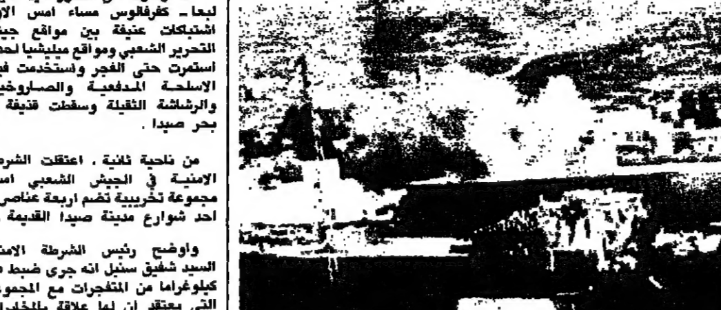
المدن يتصاعد من المنزل أثناء تفجيرها

في هذا الوقت كانت الرمايات تثل الحركة في جميع اجزاء البرجواي والليبييه المتفرقة اضافة الى مواقع الجيش في البريميو ومقر البرجواي والليبييه من مواقع الجيش في مناطق بنباتات الكمال والمراستني قد تعرضت لظهور ارميات صاروخية من مواقع المسلحين في بنباتات الليبييه والمراستني مما اضطر وحدات الجيش للرد على مصادر النار واستكثها.